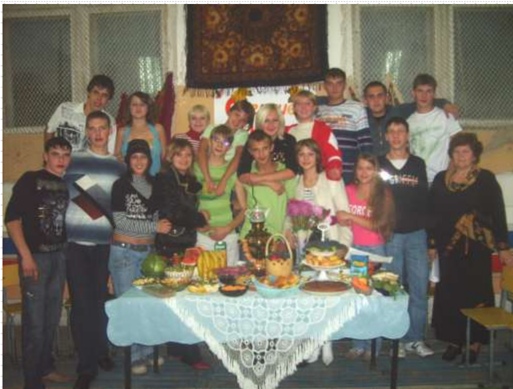
Команда 11 класса «Осенние вкусняшки»